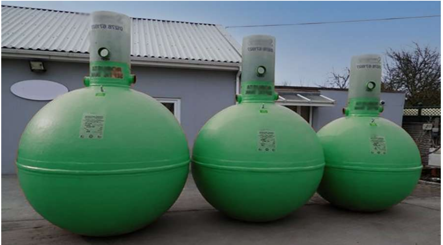
Subventions renovation fosse septique Quebec 2022